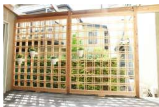
広いメインテラスは荷物おき、移動スペースと何かと便利