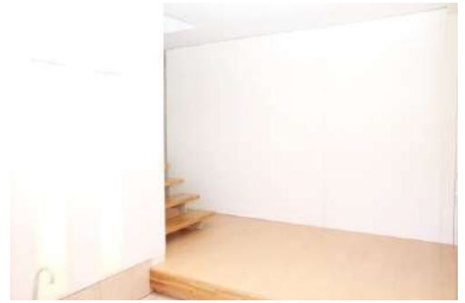
玄関用の壁があります。簡単な設置で階段を隠したり、テラスを隠したりできます。